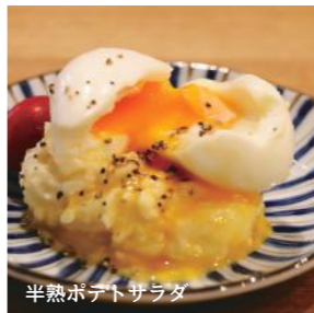
半熟ポテトサラダ