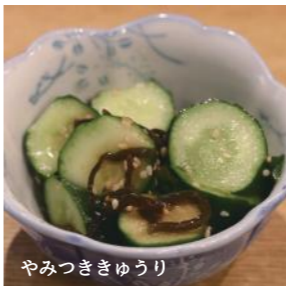
やみつきさきゅうり