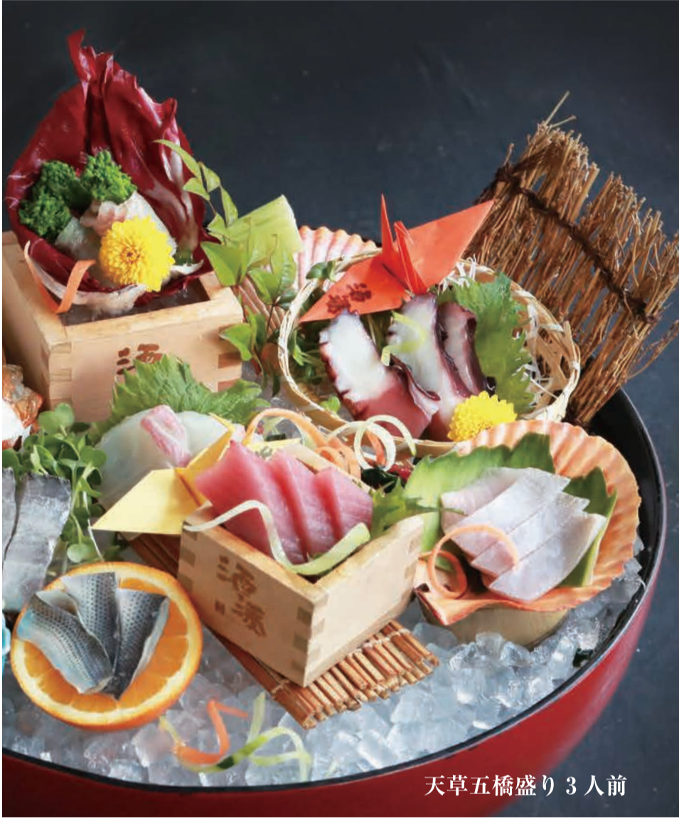
天草五橋盛り 3人前