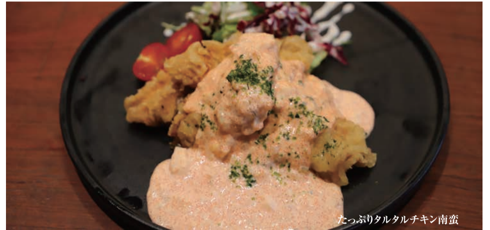
たっぷりタルタルチキン南蛮