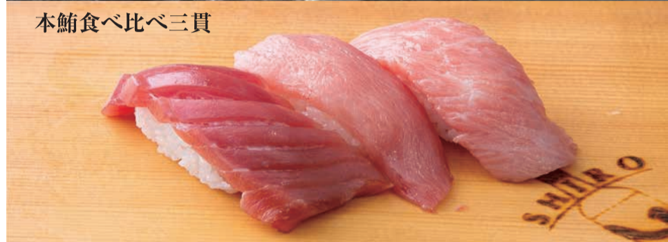
本鮪食べ比べ三貫