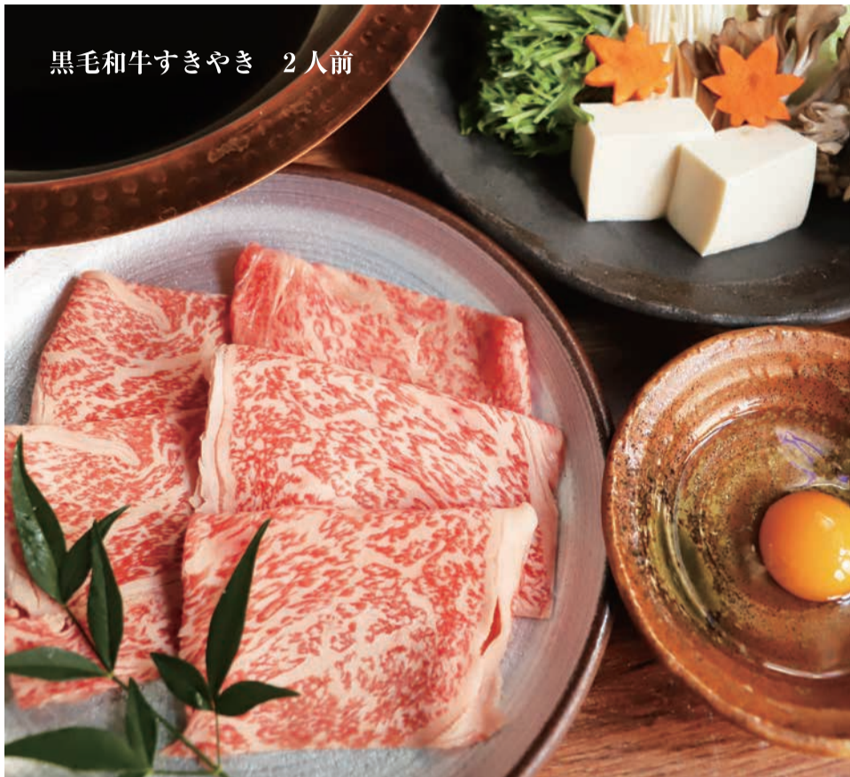
黒毛和牛すきやき 2人前