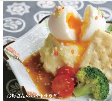
お母さんのポテトサラダ