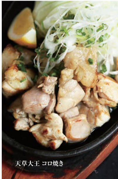
天草大王 コロ焼き