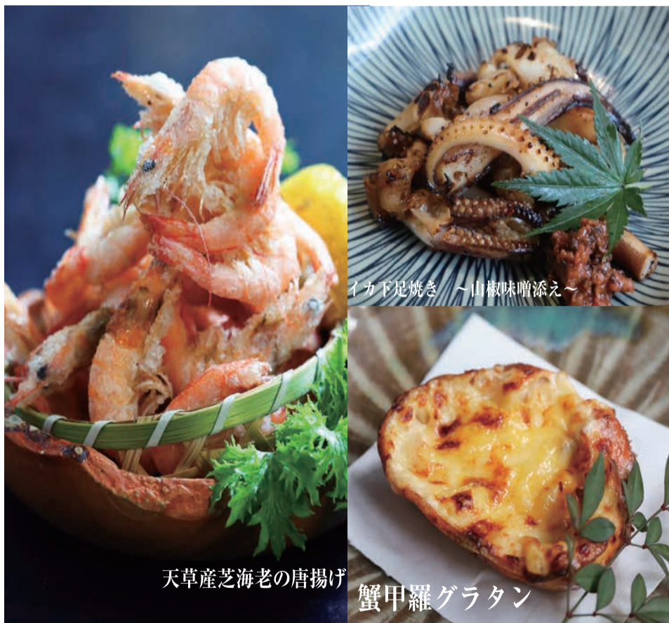
天草産芝海老の唐揚げ