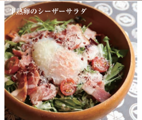
半熟卵のシーザーサラダ

※おすすめ! たっぷり明太タルタルチキン南蛮 ¥827 (¥910) Chicken Nanban with plenty of mentaiko and tartar sauce