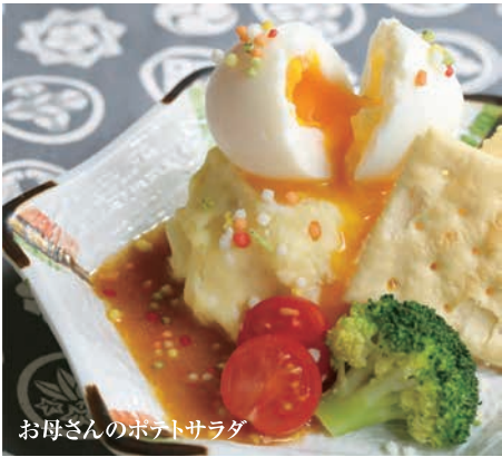
お母さんのポテトサラダ