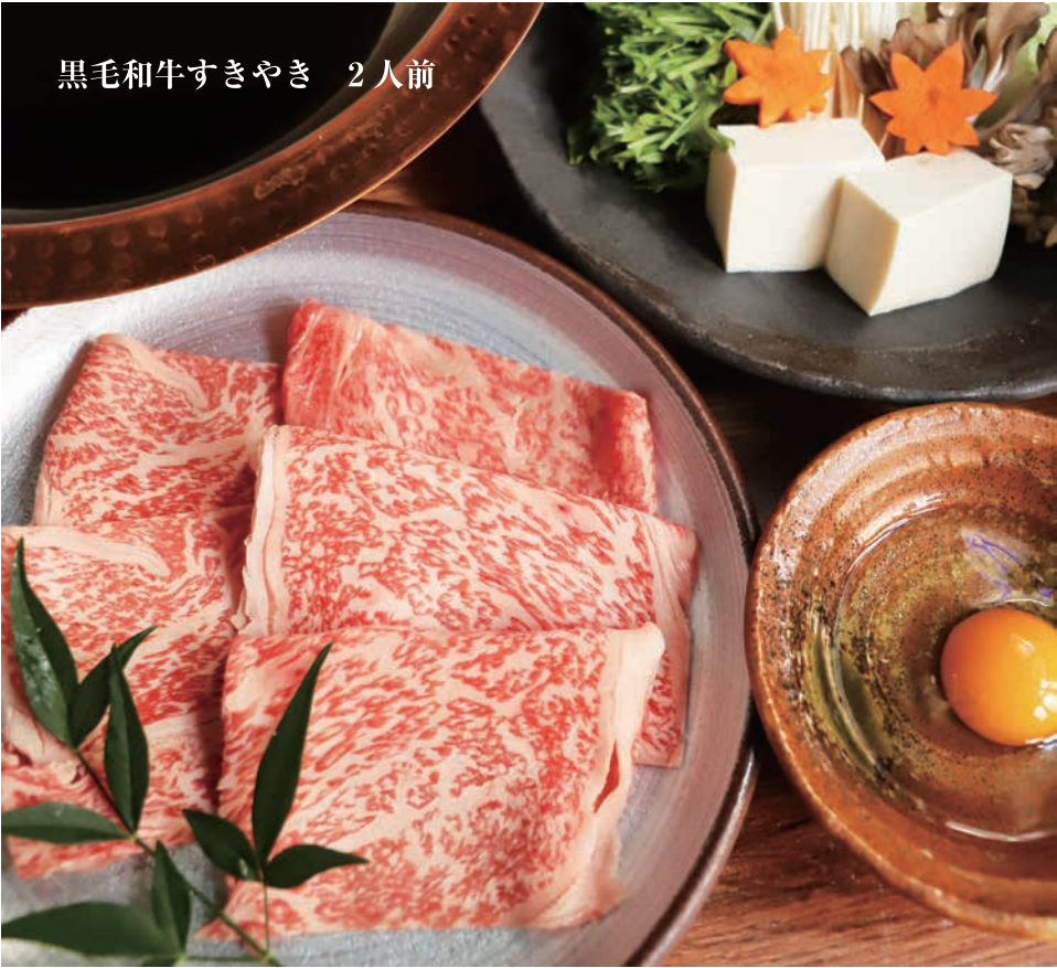
黒毛和牛すきやき 2人前