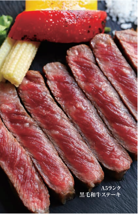
A5ランク 黒毛和牛ステーキ