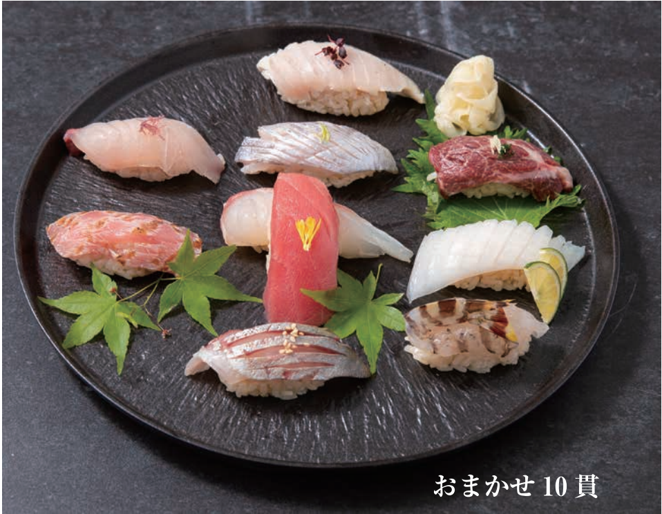
おまかせ 10 貫