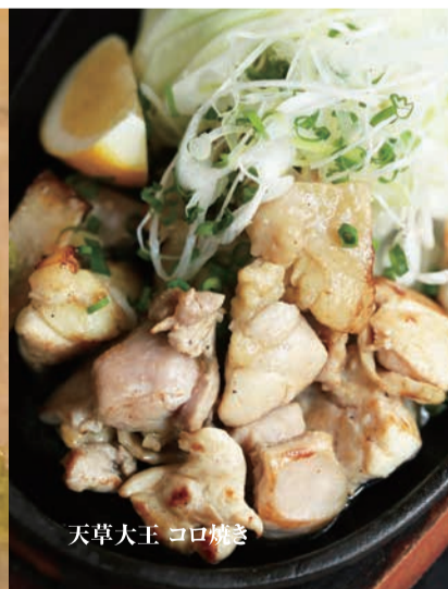
天草大王 コロ焼き