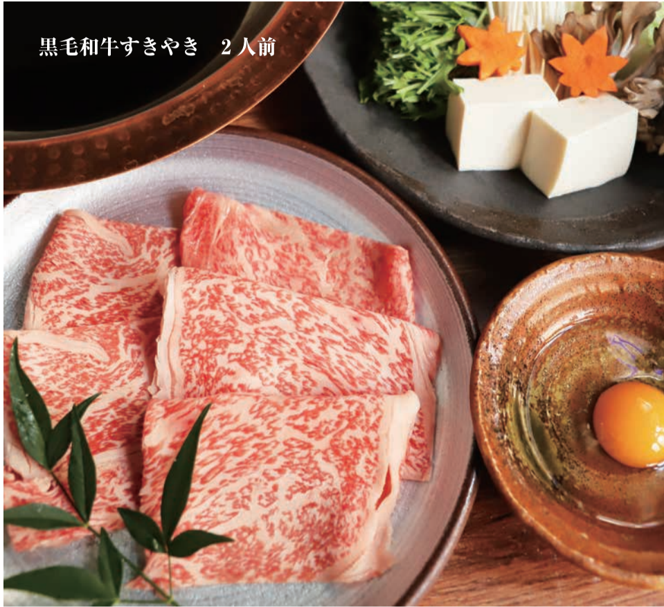
黒毛和牛すきやき 2人前