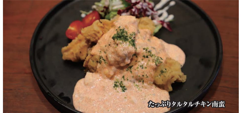
たっぷりタルタルチキン南蛮