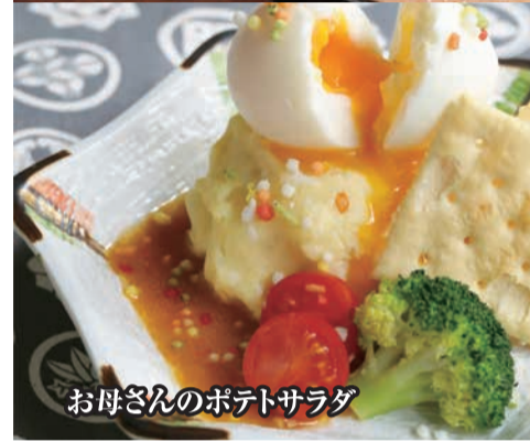
お母さんのポテトサラダ