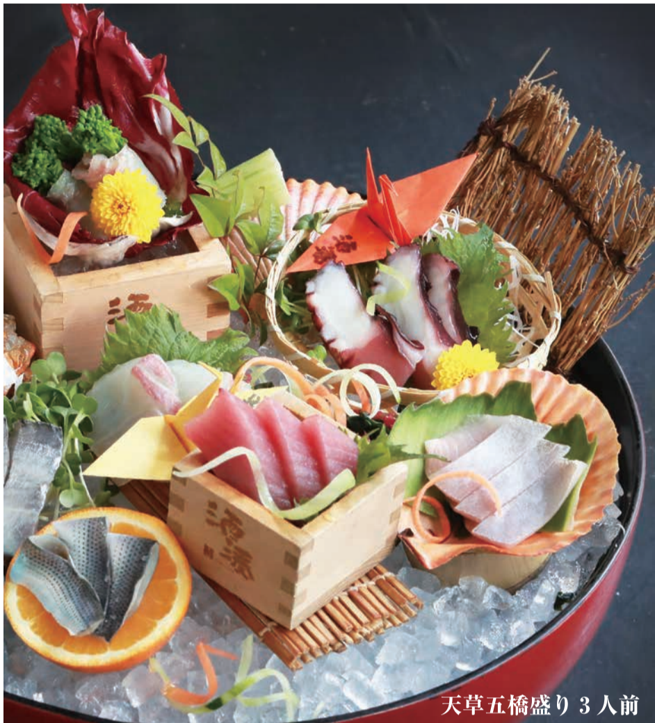
天草五橋盛り 3人前