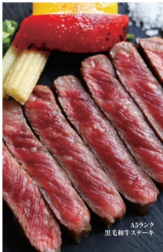
A5ランク 黒毛和牛ステーキ