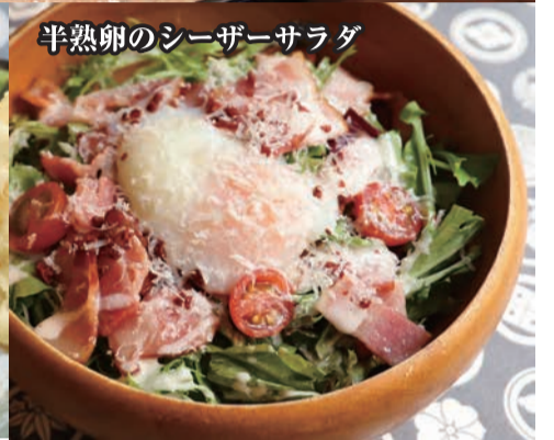
半熟卵のシーザーサラダ

たっぷり明太タルタルチキン南蛮 ¥891 (¥980) Chicken Nanban with plenty of mentaiko and tartar sauce